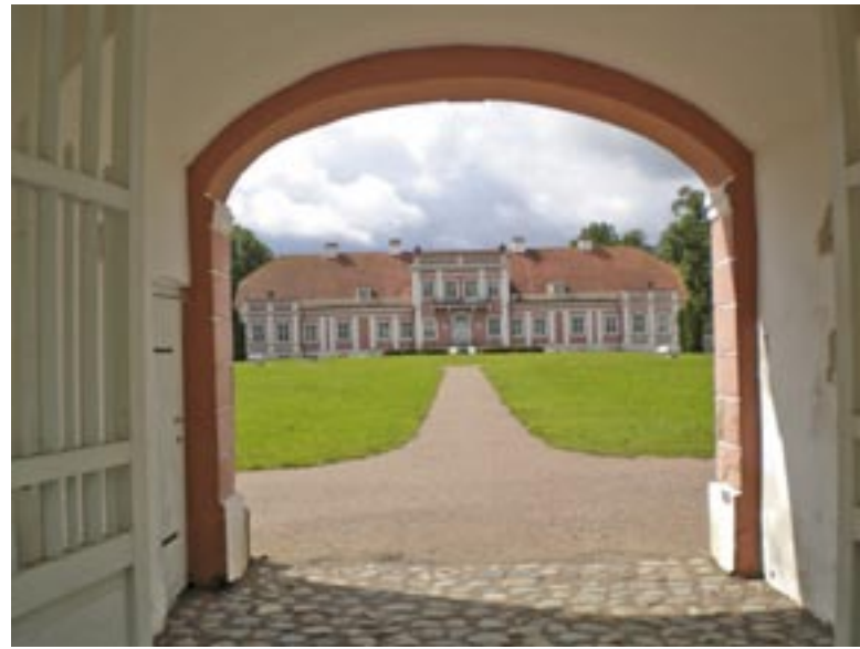
Sagadin Kartano / Virossa

Auton ja vaunun varustukseen on hyvä kiinnittää ajoissa huomiota. Ennen matkaa kaluston huolto kuntoon ja varsinkin renkaiden on syytä olla hyvät. Ylipainoa tulee hyvin herkästi. Kahdella täydellä kaasupullolla pärjää hyvin normaalin lomamatkan kesällä.