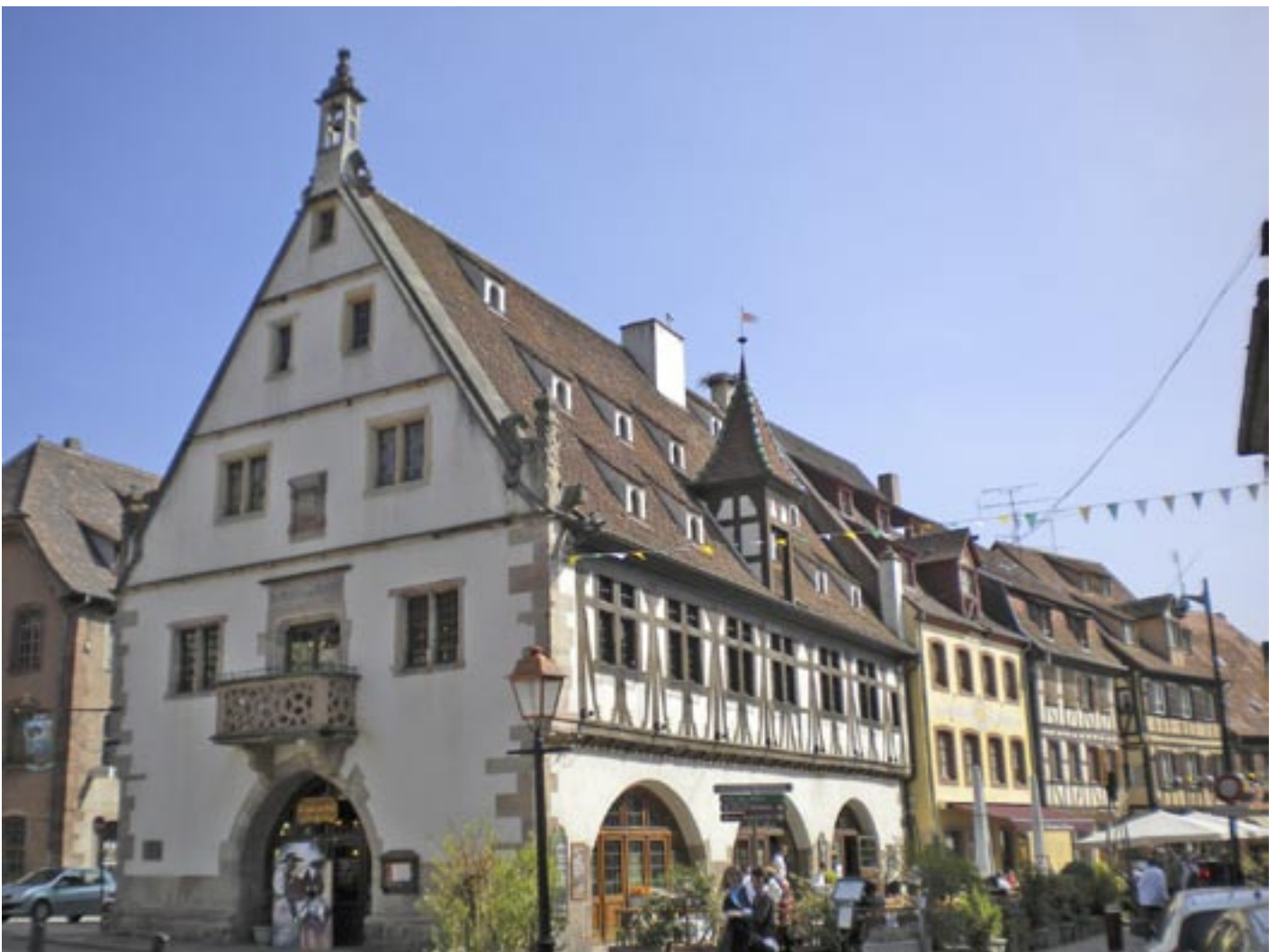
Obernain keskustaa / Ranskassa

Matkailuterveisin Rami taskula SF-C 3534 040 7231451