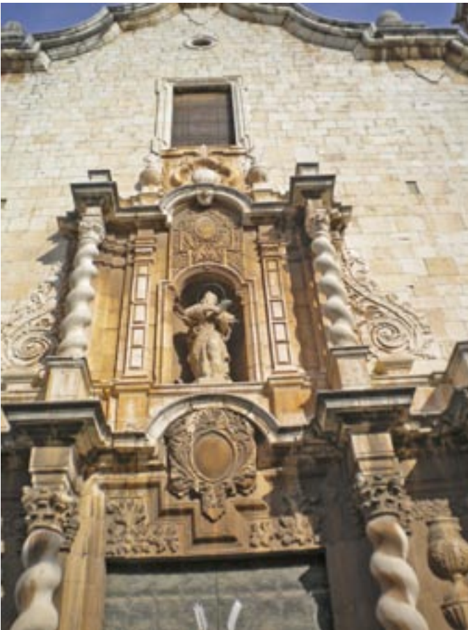
Benicarlón kirkko / Espanjassa

M atkasuunnitelmia kannattaa tehdä syksyn ja talven aikana. Näin menetellen moni asia on jo kunnossa kun matka on lähellä. Euroopassa automatkailu on nykyisin suhteellisen yksinkertaista. Matkan pituuteen vaikuttaa aika joka on käytettävissä. Suomen lisäksi viikon, parin matkalla voi mennä pohjoismaihin tai Baltiaan. Kolmen viikon matkalla ennättää jo käydä Saksassa ja Itävallassa. Neljän viikon matkalla ehtii jo etemmäs. Euroopan matkakohteen valinta kannattaa tehdä pala kerrallaan, koska alue on aivan liian iso kerralla ajettavaksi. Reitin valinta riippuu siitä minne aikoo mennä. Länsi Eurooppaan pääsee hyvin Ruotsin kautta. Ajomatkaa Saksaan kertyy noin tuhat kilometriä. Ajon lisäksi on otettava huomioon neljä laivamatkaa ja kaksi siltamaksua. Laivalla pääsee nopeasti ja helposti Keski-Eurooppaan. Liput pitää tilata ajoissa, koska laivoissa on kesäaikaan runsaasti matkustajia. Baltian kautta voi myös hyvin ajaa, varsinkin Itä-Euroopan maihin on lyhyempi matka kuin länsiosiin. Katsottavaa löytyy paljon, jokaisen maun mukaan. Kannattaa kuitenkin välttää heinäkuun lopun ja elokuun aikoja. Silloin on hyvin ruuhkaista matkailupaikoissa ja maanteillä.