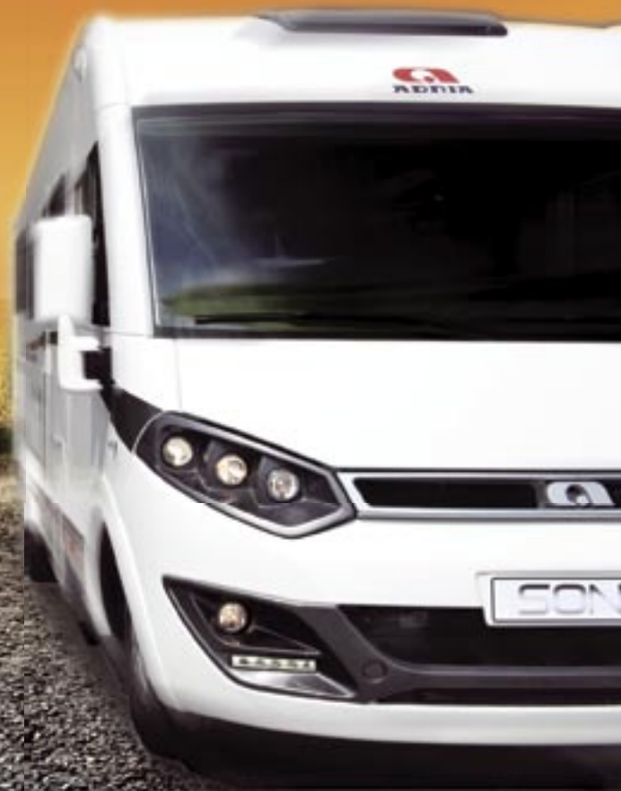
Adria Sonic ”rajoja rikkova uutuusmalli”

Vaihda nyt uuteen Adria-matkailuautoon. Saat reilun hyvityksen vaihtoautostasi.