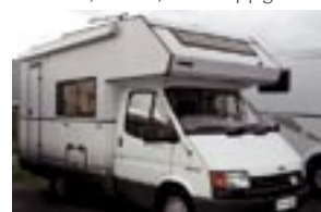
Ford Matkaaja 2.5TD,165tkm-92 siisti,Alde-lämmitys, 9.990€