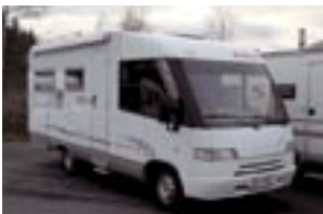
Fiat Dethleffs I 5942 1999 101tkm,2.5TD, markiisi, 25.500€