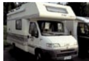
Fiat LMC 560 2.5TD -98 175tkm,siistikunt. Alde-vesikes- kuslämm. juuri kats, 16.900€