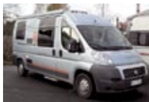
Fiat Dethleffs Globecar -08 120 hv huippuvarustein, takuu 42tkm hinta 38.500€