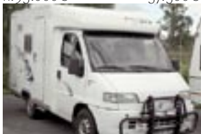
Fiat Dethleffs Bus, pit.5m, -97 jokapäiväiseen ajoon 16.900€