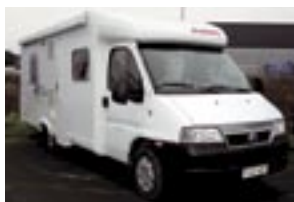
Fiat Dethleffs T6501 2005 73tkm, Elegance, 34.900€

Luotettavaa caravankauppaa jo 25 vuotta. Tarjoamme edullisen ja joustavan rahoituksen hankinnallesi!