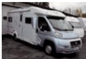
Fiat TEC Rotec TI 662 -07 Alde- vesikesk-lämm, nestekiert. lattialäm,66tkm, takuu 44.500€