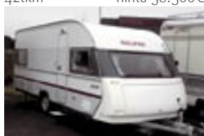
Solifer 560MH Artic takuu 2008 Hyvät varusteet 22.500€