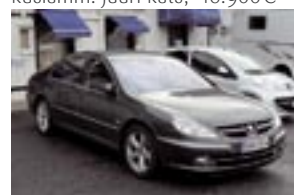
Peugeot 607 2.2 164hv -06 146tkm,aut.ilm.ym,siisti14.900€