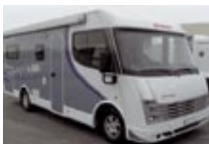
Fiat Dethleffs I 6501 3.0TD -07 66tkm,huippuvarusteet, uutena n.95.000€ 57.500€